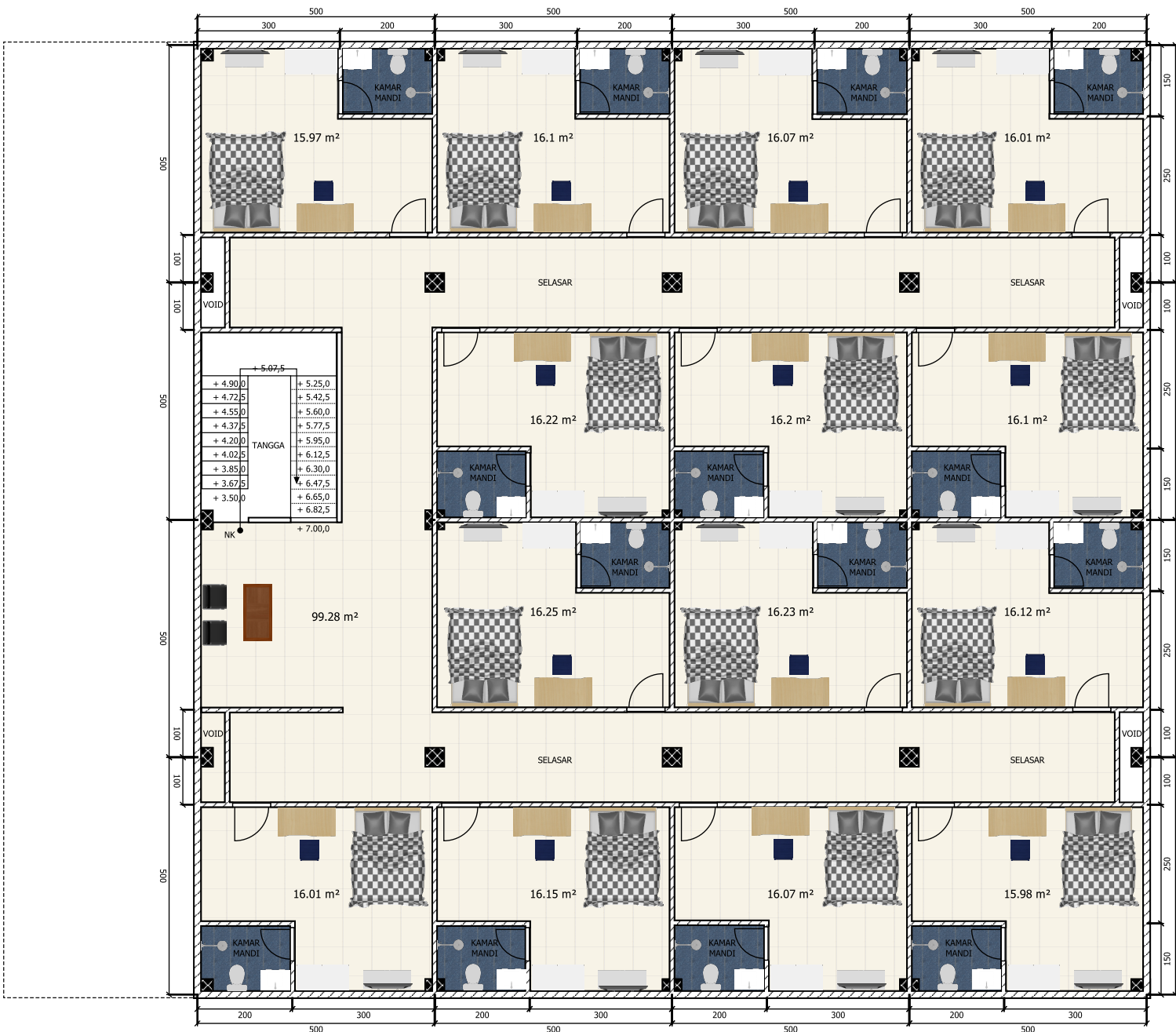
DENAH LANTAI 2 SKALA 1:125